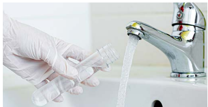
Entnahme einer Wasserprobe zur weiteren Untersuchung

Nach einer schrittweisen Wiedereingliederung arbeitete der Versicherte nach einem Jahr wieder voll in seinem Beruf. Er war aber körperlich weniger belastbar als vor der Erkrankung und litt unter Luftnot bei Belastung. Seine Asthmatherapie musste dauerhaft intensiviert werden. Die Polyneuropathie hatte sich nach anderthalb Jahren zurückgebildet.