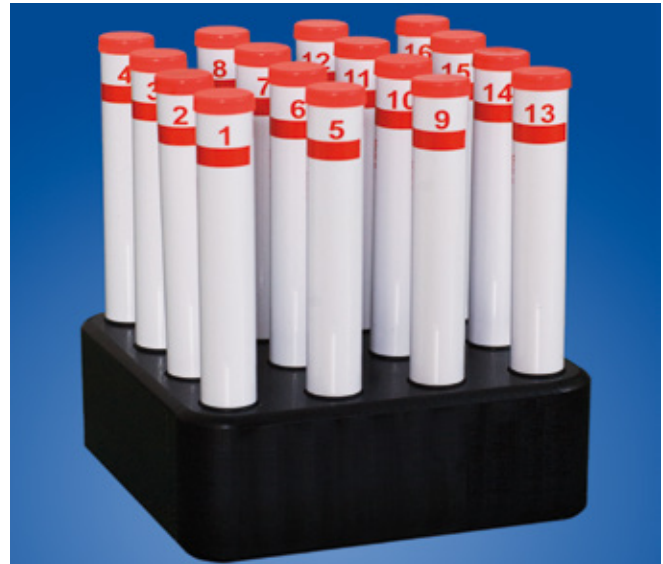
Abb.1: Mithilfe von Riechstiften, so genannten „Sniffin' Sticks“, kann man die individuelle Wahrnehmungsschwelle untersuchen, aber auch die Fähigkeit, Gerüche zu erkennen und zu unterscheiden.

Beim Riechen werden Gerüche mit individuellen Erfahrungen und Erinnerungen verknüpft. Diese Erfahrungen entscheiden später darüber, ob wir einen Geruch mögen oder nicht, ohne dass uns diese Verbindung bewusst ist. So sind beispielsweise kulturelle