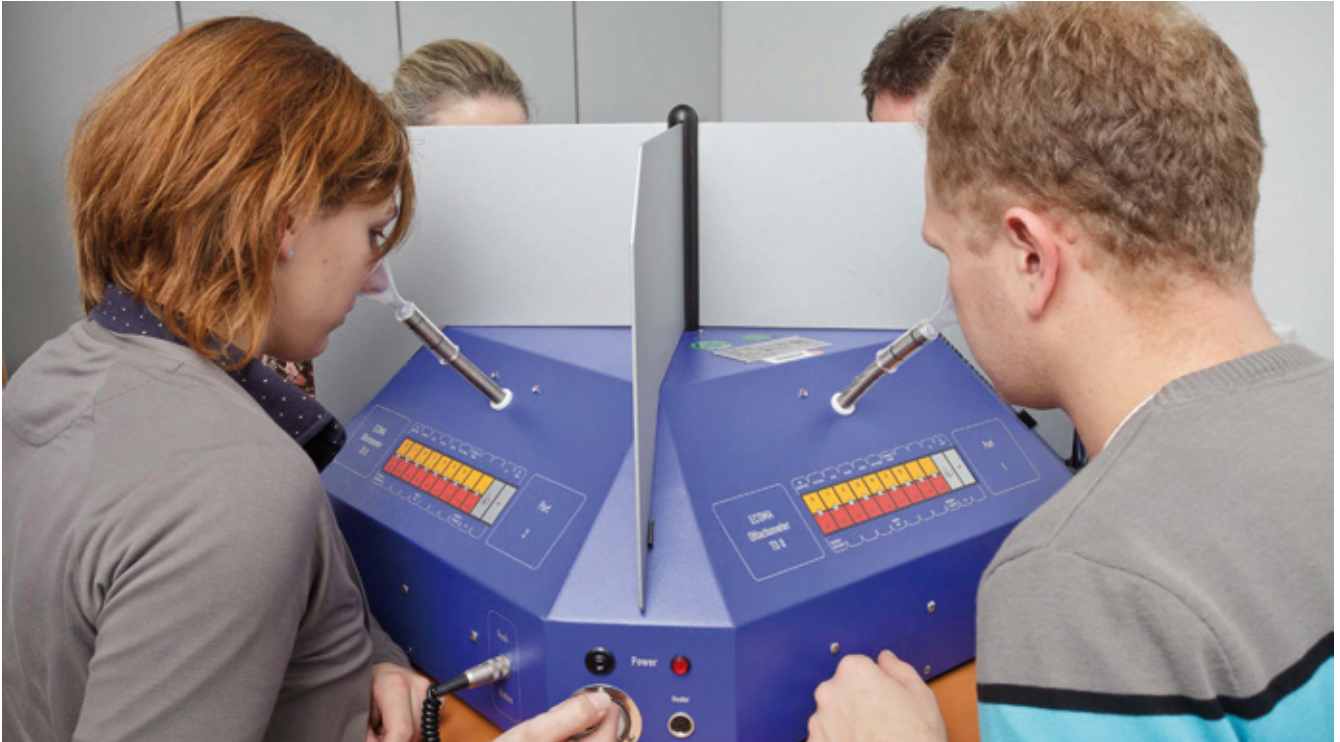
Abb.2: Mit Hilfe des Olfaktometers kann der Geruchssinn geprüft werden.

samkeit auf die Wahrnehmung der eignen körperlichen Reaktionen gelenkt. In Folge dessen werden auch unbedeutende Symptome die wie z.B. leichte Kopfschmerzen, die in einer anderen Situation vielleicht gar nicht bemerkt worden wären, im Sinne der Erwartung interpretiert.