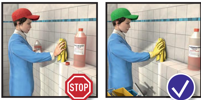
Wir vermeiden direkten Kontakt mit Reinigungs- sowie Pflegemitteln und achten auf die richtige Dosierung.